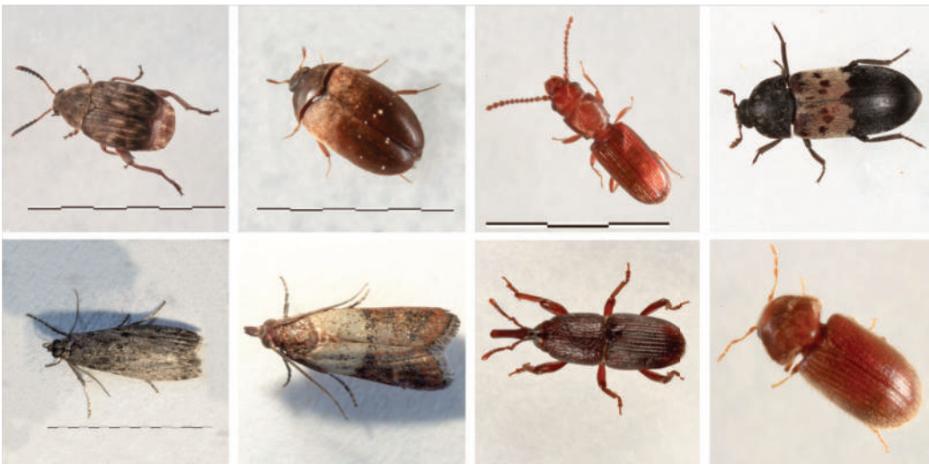
Abb. 1: Über 1400 Arten von Insekten gelten als mit Vorräten assoziiert, als Schädlinge wirtschaftlich bedeutsam sind etwa 100 Arten. Dargestellt sind hier (von o. l. nach u. r) der Speisebohnenkäfer Acanthoscelides obtectus , der Braune Pelzkäfer Attagenus smirnovi , der Rotbraune Leistenkopflattkäfer Cryptolestes ferrugineus , der Gemeine Speckkäfer Dermestes lardarius , die Mehlmotte Ephestia kuehniella , die Dörrobstmotte Plodia interpunctella , der Kornkäfer Sitophilus granarius und der Brotkäfer Stegobium paniceum (Fotos: Misgaiski/JKI).

Vorratsschädliche Insekten nutzen die Produktfeuchte und erzeugen aus den aufgenommenen Kohlenhydraten durch Atmung Kohlendioxid, Wasser und Energie. Wasser und Energie werden von den Insekten selbst genutzt, aber auch an die Umgebung abgegeben, weshalb ein lagerndes Produkt bei Massenbefall immer feucht und warm wird. Dadurch entstehen dann zusätzlich günstige Lebensbedingungen zur Massenvermehrung von Milben und Mikroorganismen, was den Verderb des Lagergutes beschleunigt. Dies verdeutlicht, dass schon ein geringer Befall mit vorratsschädlichen Insekten nicht toleriert werden kann. Daher ist ein hocheffizienter Vorratsschutz unverzichtbar.