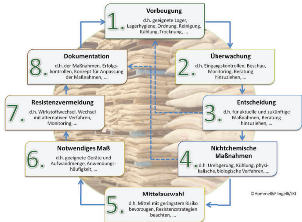
Abb. 4: Entscheidungsalgorithmus im Vorratsschutz in Anlehnung an die acht allgemeinen Grundsätze (EU-Richtlinie 2009/128 EG, Anhang 3)(Grafik: Hommel & Flingelli/JKI)

Der Aktionsplan soll somit einen entscheidenden Beitrag zur Sicherung ausreichender Vorratsschutzverfahren leisten, damit auch zukünftig ein integrierter Vorratsschutz möglich ist.